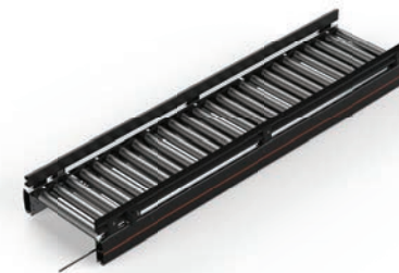
CT01 Roller Conveyor Straight 24V