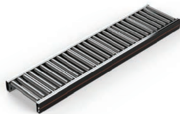
CT01 Roller Conveyor Straight Non Driven