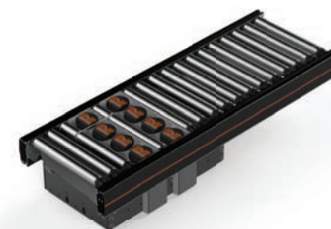
KP01 Pop-up Module 24V