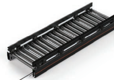
CT01 Roller Conveyor Straight Accumulating 24V