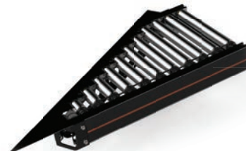
CT01 Roller Conveyor Merge 24V