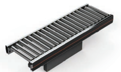
CT01 Roller Conveyor Straight General 400V