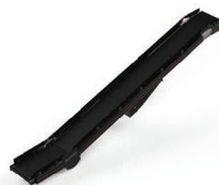
CT02 Belt Conveyor Incline 400V