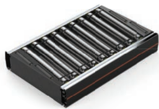
CT01 Roller Conveyor Alignment 24V