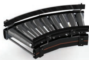
CT01 Roller Conveyor Curve 24V