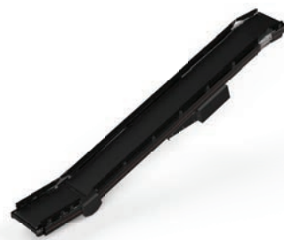
CT02 Belt Conveyor Decline 400V