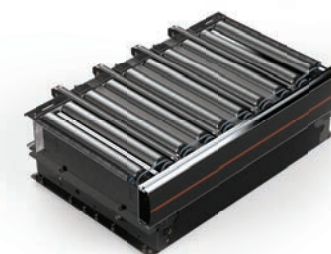
KP02 Transfer Module 24V